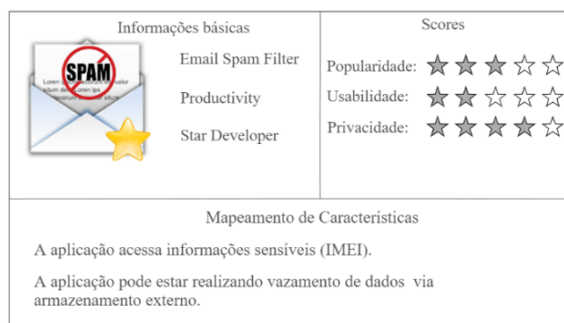
Figura 3: Interface com os resultados do Email Spam Filter .

A Figura 3 apresenta um screenshot da interface do usuário com os resultados referentes ao Email Spam Filter com o nome da app , categoria, desenvolvedor e scores . No caso do MPL foram encontrados acesso ao IMEI e escrita em armazenamento externo. Essas informações são agrupadas e passadas aos usuários para que fiquem cientes que a app pode acessar essa informação confidencial e causar um possível vazamento de dados.